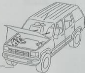
BOQUEL - Arreglo Busch